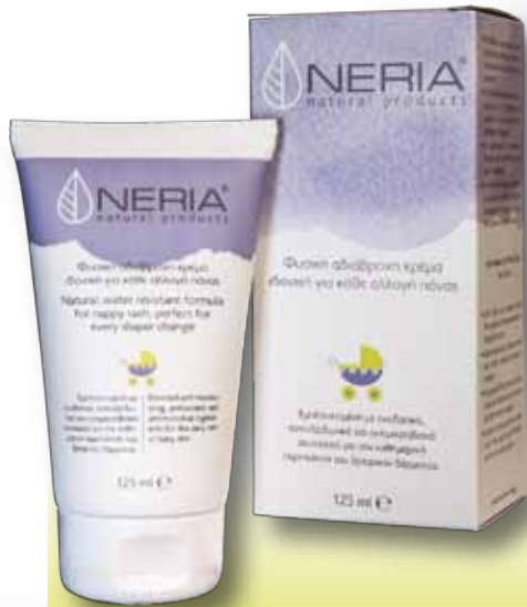
Φυσική αδιάβροχη κρέμα