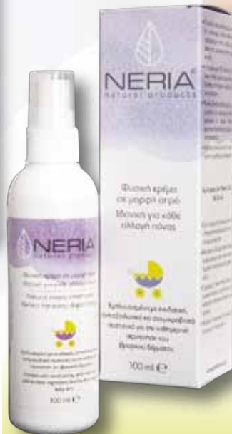
Φυσική κρέμα σε μορφή σπρέι